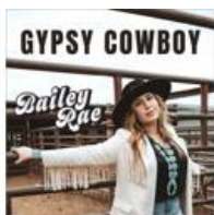
Gypsy Cowboy - Single (2021)