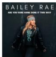
Are You Sure Hank Done It This Way -... (2021)