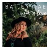
I'm in Love - Single (2020)