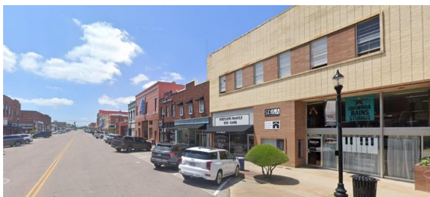
Shawnda Rains Studios