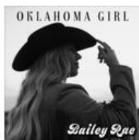
Oklahoma Girl - Single (2022)