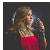
Never Been This Lonely - Single (2020)