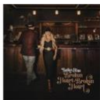
Broken Heart To Broken Heart - Single (2023)