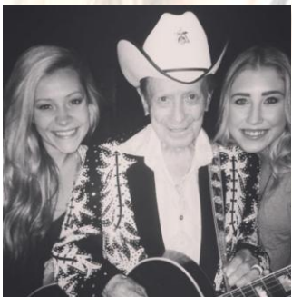
Au Grand Ole Opry avec Brad Paisley

Elles passent aussi sur la scène du Grand Ole Opry le même soir que Brad Paisley.