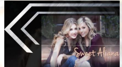
Big Machine Records LLC, 16th Avenue South, Nashville