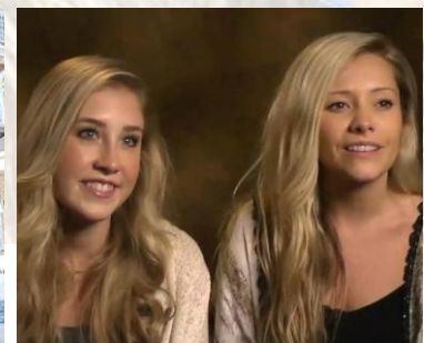
En compagnie du regretté " Jimmy Dickens "