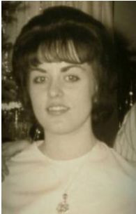
Fairdale High School