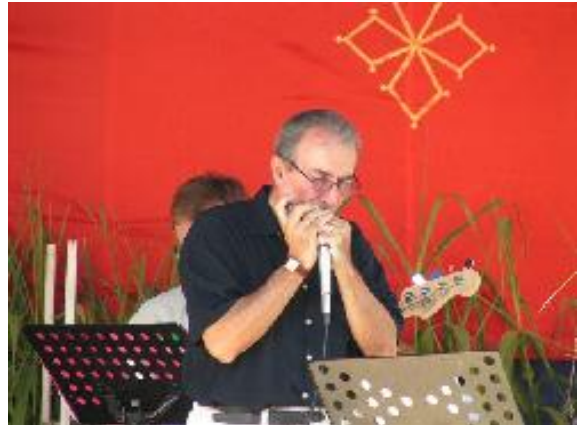
En concert à Toulouse-2012

Classé 4e sur 10 " Radio Galaxie Canada" au top 10 de la County Music en Août 2006 Classé 10e sur 15 à " Radio Allemande Talsa" Country Music en Mars 2007.