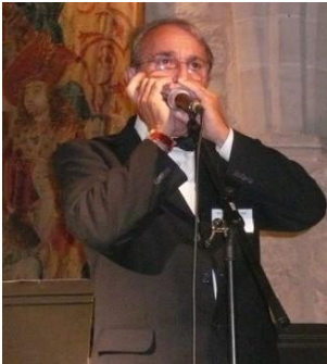
Paris en 2009 concert château de Royaumont