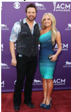
48th- annual- ACM –Awards

"La chose la plus importante dans ma vie en ce moment est ma famille et mon petit garçon".