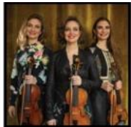
The Quebe Sisters (2019)