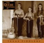
Texas Fiddlers (2003)