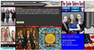
Leur page sur le site de WRCF (Clic sur image)

Le trio a choisi en dehors des harmonies et des violons, de mettre en lumière des solos individuels, montrant la virtuosité de chaque membre. En écoutant cet album, on se sent comme transporté dans les anciens Dance Halls du Texas dans lesquels Bob Wills chantait.