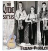
The Quebe Sisters TEXAS-FIDDLERS