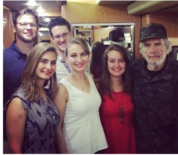
En compagnie de Merle Haggard