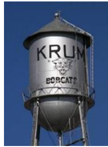
Krum water tower