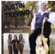
Justin Trevino & the Quebe Sisters - Single (2017)