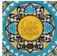
Every Which-A-Way (2014)