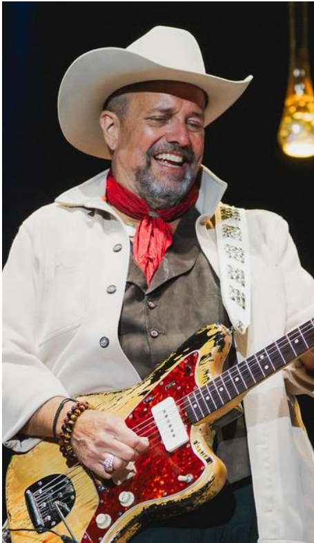
Vie et carrière

Raúl Francisco Martínez-Malo Jr. (7 août 1965 – 8 déc.2025) était un américain, chanteur, auteur-compositeur, guitariste et producteur de disques. Il était à la fois le chanteur et auteur-compositeur du groupe de musique country The Mavericks, avec lequel il a co-écrit plusieurs singles, ainsi que le single « In My Dreams » de Rick Trevino en 2003