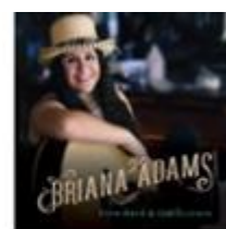
Dive Bars & Old Guitars - EP (2017)