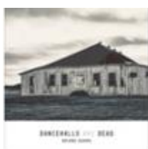
Dancehalls Are Dead - Single (2019)