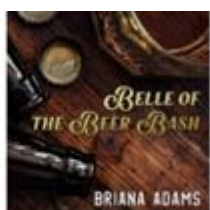
Belle of the Beer Bash Single (2021)