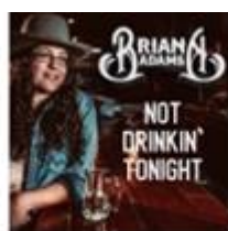
Not Drinkin' Tonight - Single (2019)