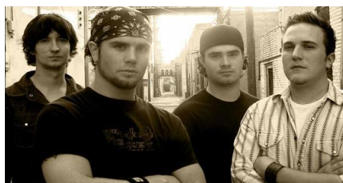
Band "Crimson Envy"

Cameran a pour objectif principal de poursuivre et construire une carrière musicale.