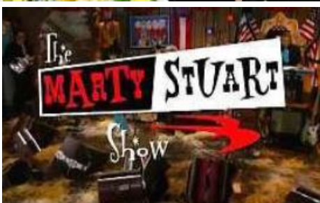
The Quebe Sisters Programmé sur le "Marty Stuart Show 2009"